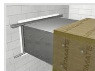
U Protect Slab 4.0

Protection incendie pour les conduits rectangulaires horizontaux ou verticaux.